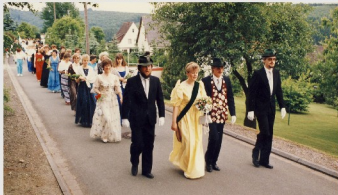
Das Königspaar im Festzug mit Hofstaat