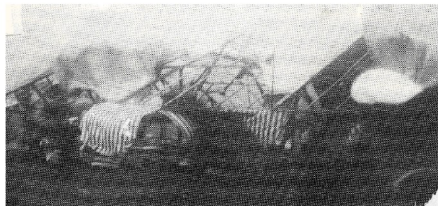
Das Foto zeigt das Festzelt kurz nach dem Gewitter

Nach einer Stunde war dies mit einem einmaligen Arbeitseinsatz geschafft und das Schützenfest wurde fortgesetzt und nahm einen harmonischen und sehr guten Verlauf.