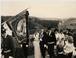
Das Königspaar im Festzug