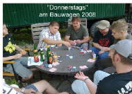
"Donnerstags" am Bauwagen 2008