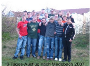
3-Tages-Ausflug nach Medebach 2007