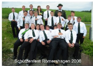
Schützenfest Römershagen 2008