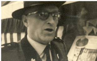
Das Foto zeigt den im Jahr 1970 verstorbenen Major Josef Jacob

Der Einladung zum Jubiläums-Schützenfest in Römershagen soll Folge geleistet werden.