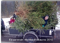
Einsammeln Weihnachtsbäume 2010