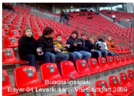
Bundesligaspiel Bayer 04 Leverkusen - VfB Stuttgart 2009