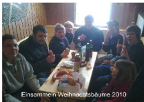
Einsammeln Weihnachtsbäume 2010