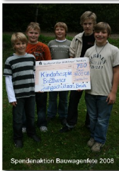
Spendenaktion Bauwagenfete 2008