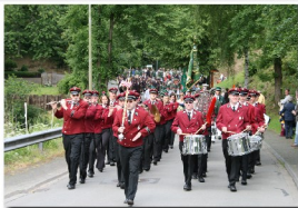
im Festzug in Brün 2008