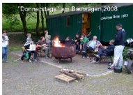
"Donnerstags" am Bauwagen 2008